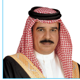
حضرة صاحب الجلالة الملك حمد بن عيسى آل خليفة ملك مملكة البحرين