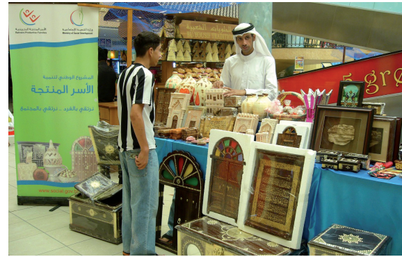
تسويق منتجات الأسر المنتجة في المجمعات التجارية

وبنظرة سريعة عن أهم اختلافات برامج جرامين مع برامج التمويل متناهي الصغر التقليدية هي في تركيز البرامج علي المرأة، وفي إعطاء القروض الجماعية الهادفة إلي خلق