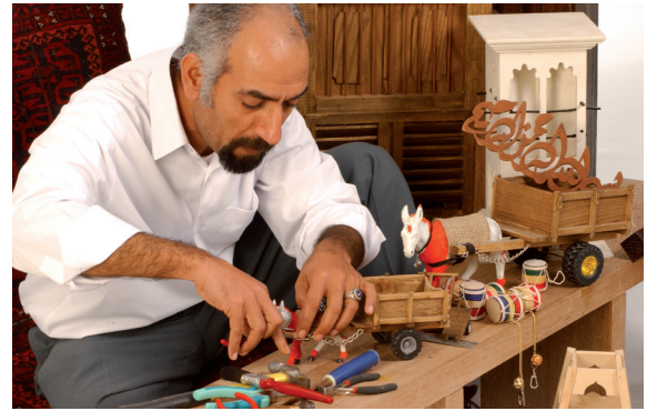
حرفي بحريني في مجمع العاصمة

وتتمثل أغراض البنك في تقديم القروض متناهية الصغر قصيرة و متوسطة الأجل للأفراد و الجماعات و المؤسسات الغير هادفة للربح و المساهمة في رؤوس أموال الشركات المساهمة البحرينية كما أنه من أغراض البنك تقديم المعونة الفنية فيما يتعلق بدراسات الجدوى و التدريب على بدء مشروعات متناهية الصغر و كذلك تدريب المنظمات الغير هادفة للربح على تقديم فرصة للأفراد محدودي الدخل بهدف التركيز على تعزيز قدرات محدودي الدخل وزيادة أصولهم والعائد منها وتحسين الظروف الاجتماعية والاقتصادية لهم من خلال:-