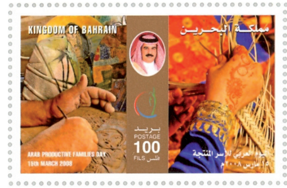
طابع بريدي تم إصداره بمناسبة اليوم العربي للأسر المنتجة ١٥ مارس ٢٠٠٨

هـ- اقامة شبكات مع البرامج والمؤسسات العاملة في مجال برامج كسب الرزق مثل المؤسسات المالية، الوكالات العاملة في مجال التمويل الصغير وبرامج داعمة أخرى.