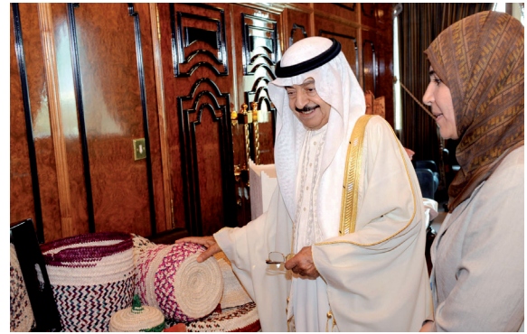
تفقد صاحب السمو الملكي الأمير خليفة بن سلمان آل خليفة لمنتجات الأسر البحرينية