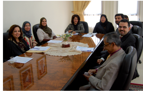
الاجتماع مع جمعية رعاية الطفل والأمومة عن آلية التعاون مع بنك الأسرة

سوف يوفر بنك الأسرة دعماً للمؤسسات متناهية الصغر والتشغيل الذاتي في البحرين، حيث يوفر وحدة للتدريب والدعم الفني لنساهم بشكل فعال في إستكمال