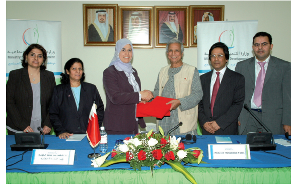
توقيع إتفاقية التعاون بين مؤسس جرامين ووزارة التنمية الاجتماعية

بنك الأسرة سوف يطرح عدة برامج تمويلية وخدمات متخصصة تتوافق مع الشريعة الإسلامية وتغطي كافة احتياجات الأسرة من التمويل الصغير وبشروط ميسرة تمثل اقل تكلفة إقراض موجودة في مملكة البحرين.