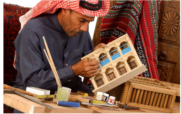
منتج بحريني من التراث في مجمع العاصمة

منطقة محددة يتم الاتفاق عليها ولا تسمح لجميعة بتغطية جميع مناطق البحرين حتي لا يخلق مجال للتنافس بين شركاء البنك.