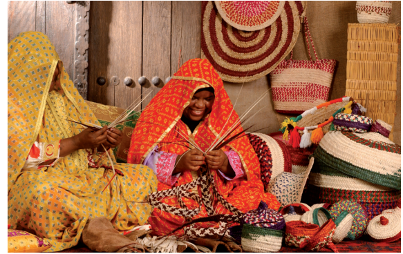
إحدى الأسر البحرينية في مجمع العاصمة

تتقدم الجهات الوسيطة (الجمعيات الأهلية) بمقترحات لتنفيذ مشروعات تنموية للبنك في إطار النطاق الجغرافي لأنشطتها، بينما يقوم البنك بدراسة هذه المقترحات وتقييمها، وفي حالة إقرارها يتعاقد مع هذه الجمعيات ويقدم التمويل اللازم لها.