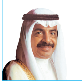
صاحب السمو الملكي الأمير خليفة بن سلمان آل خليفة رئيس الوزراء