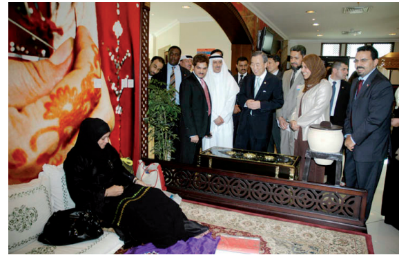
زيارة الأمين العام للأمم المتحدة لمجمع العاصمة لمنتجات الأيدي البحرينية

أحد الأهداف الرئيسية للبنك هي تعزيز مشاركة المرأة في التنمية وسد الفجوة النوعية في الحصول على القروض بين الذكور والإناث، يجري ضمن إطار التمويل المتناهي الصغر توفير الفرص للنساء لمباشرة أعمال صغيرة داخل وحول المنزل، فالمرأة المعيلة لأسرة مثلًا تعتبر أكثر الفئات احتياجًا، فهي مسئولة عن تربية أطفالها وقد لا تمتلك مهارات للعمل وأيضاً القدرة والمعرفة لتأسيس نشاط مدر للدخل. هذه المرأة في حاجة لأن