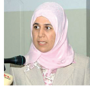
الدكتورة فاطمة البلوشي وزيرة التنمية الإجتماعية

لذا فإن تأسيس بنك الأسرة كبنك اسلامي للتمويل متناهي الصغر يأتي متوافقا مع هذه التوجهات العالمية الهادفة لتمكين الأفراد وإطلاق قدراتهم وتحسين مستوياتهم المعيشية كمؤسسة تنموية متخصصة توفر التمويل متناهي الصغر كأحد آليات دعم الفئات الأقل دخلا، وترجمة للتاريخ الحافل لمملكة البحرين في مجال التمويل الصغير، فقد بدأ مشروع