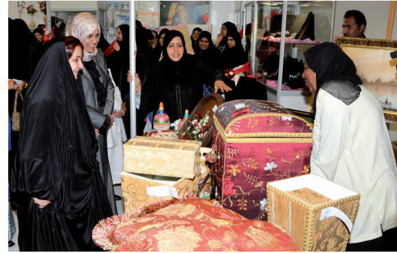
صاحبة السمو الملكي الأميرة سبيكة بنت إبراهيم آل خليفة تتفقد معرض الأسر المنتجة (مارس ٢٠٠٦)

الثقة: يعتمد بنك الأسرة الثقة المتبادلة بينه و بين الأفراد كأحد أهم ركائز التعاون معهم و يوفر