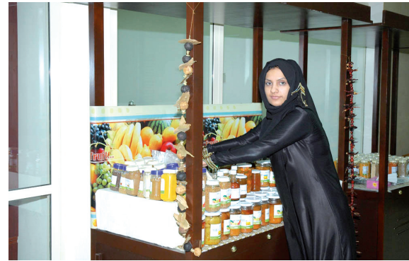
صاحبة مشروع صغير بمجمع العاصمة