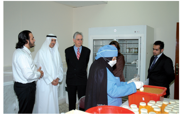
زيارة أحد الخبراء الأجانب في الإطلاع على حاضنة المنتجات الغذائية بستره