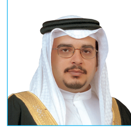
صاحب السمو الملكي الأمير سلمان بن حمد آل خليفة ولي العهد نائب القائد الأعلى