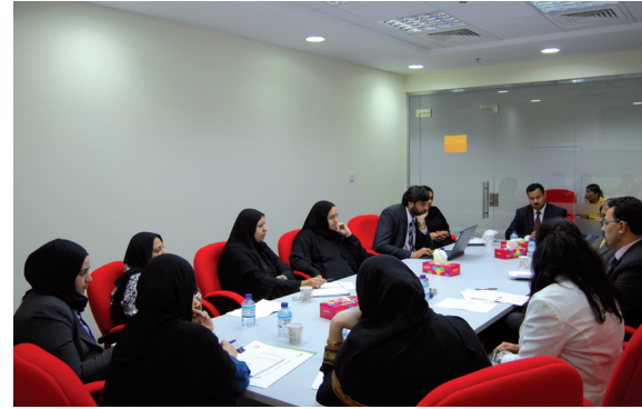
اجتماع المسؤولين في المنظمات الأهلية بشأن خدمات بنك الأسرة

أن لا تشترط تقديم ضمانات مالية أو عينية للقروض التي تمنحها.